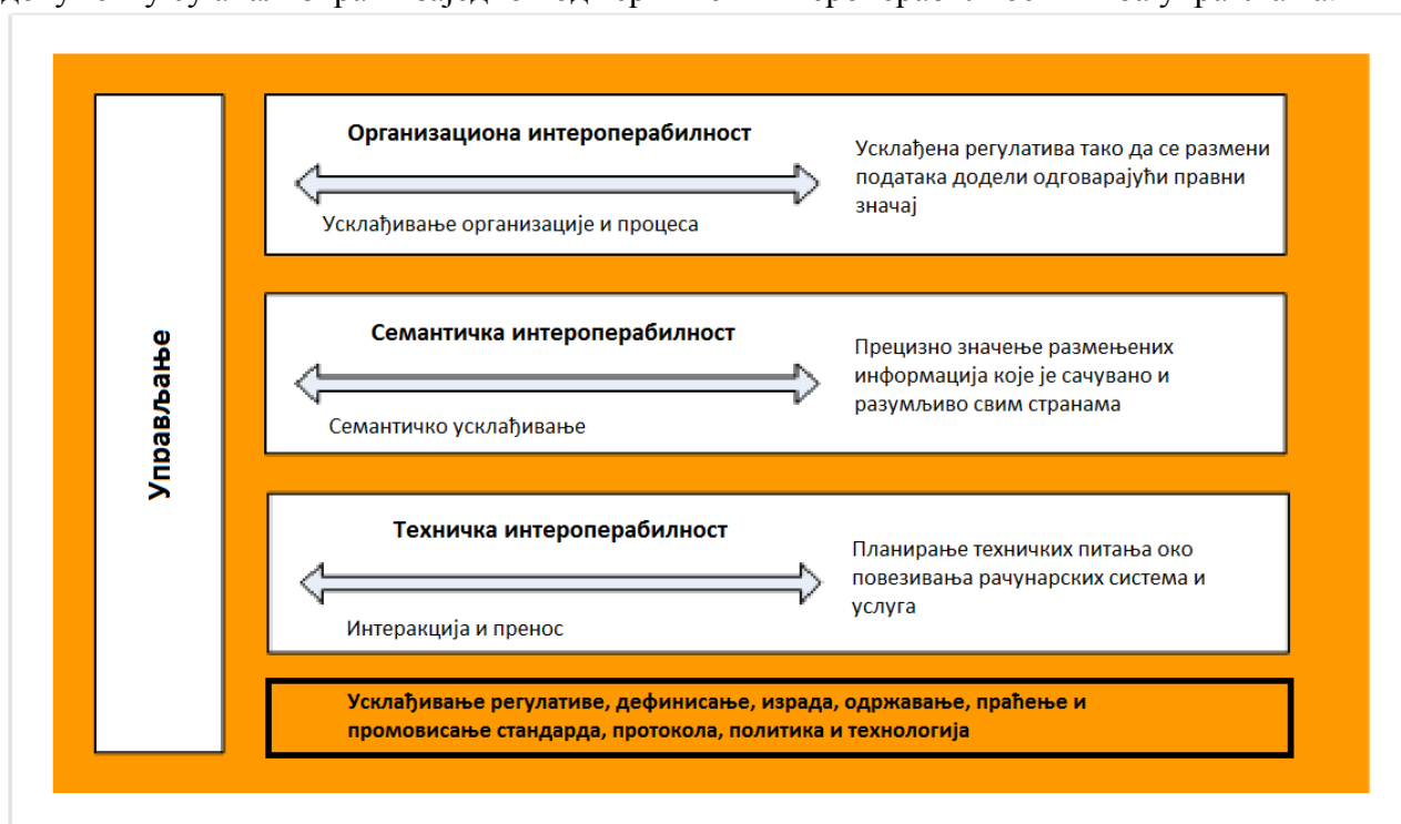
Слика 3: Нивои интероперабилности (прилагођена верзија ЕОИ в2.0 12 )

Европски оквир интероперабилности (ЕОИ) в.1.0 9 и Студијска група за интероперабилност електронске управе у оквиру Развојног програма Уједињених нација (UNDP) 10 описује интероперабилност на следећа три нивоа: технолошком, семантичком и организационом. Европски оквир интероперабилности в.2.0 11 проширује ове нивое додајући интероперабилности политичку и правну димензију, чиме се добијају правна, организациона, семантичка и техничка интероперабилност која се анализира у специфичном политичком контексту. С обзиром на то да из угла постојећег регулаторног предлога правна интероперабилност и политички контекст представљају спољашњу средину, у овом документу су анализирани заједно под термином интероперабилност нивоа управљања.